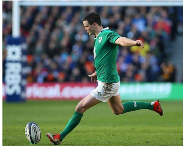
Fíor 6. Johnny Sexton

Ainmníodh Johnny Sexton mar Imreoir Rugbaí an Domhain sa bhliain 2018. Tá iomrá ar Johnny mar gheall ar cháilíocht a chluiche ciceála.