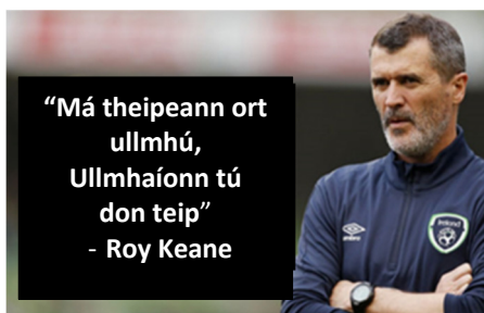
Fíor 2. Iarchaptaen agus iarbhainisteoir cúnta ar fhoireann sacair Phoblacht na hÉireann, Roy Keane

Mínigh dhá mhodh dhifriúla le haghaidh traenáil chorpacmhainne a d'fhéadfaí a úsáid chun lúthchleasaithe a ullmhú le feidhmiú i do rogha gníomhaíocht choirp.