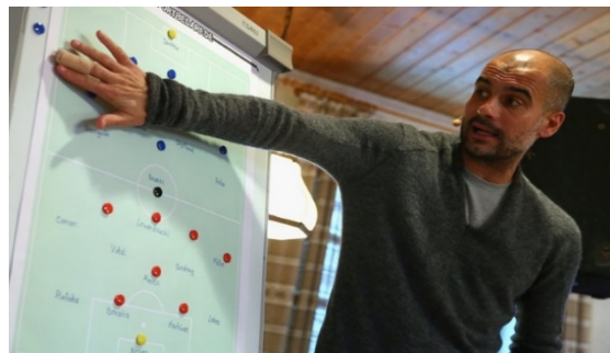
Fíor 10. Pep Guardiola, Manchester City

Teastaíonn na scileanna teicniúla ó chóitseálaithe le sceidil traenála agus chleachtaidh a eagrú, a phleanáil agus a chur ar fáil dá lúthchleasaithe. Ó fhorbairt pleananna tréimhsithe go dearadh agus cur i gcrích seisiúin traenála indibhidiúla, tá ar chóitseálaithe cuidiú lena lúthchleasaithe i dtéarmaí a bhforbartha coirp agus oirbheartaíochta chomh maith lena bhforbairt theicniúil.