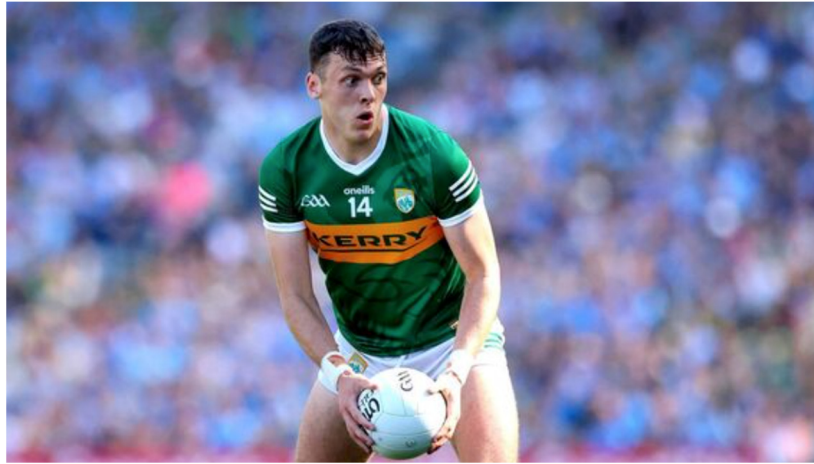
Fíor 8. Múinteoir Corpoideachais agus imreoir Peil Ghaelach as Ciarraí, David Clifford, ag comhdhíriú agus é réidh chun saorchic a thógáil